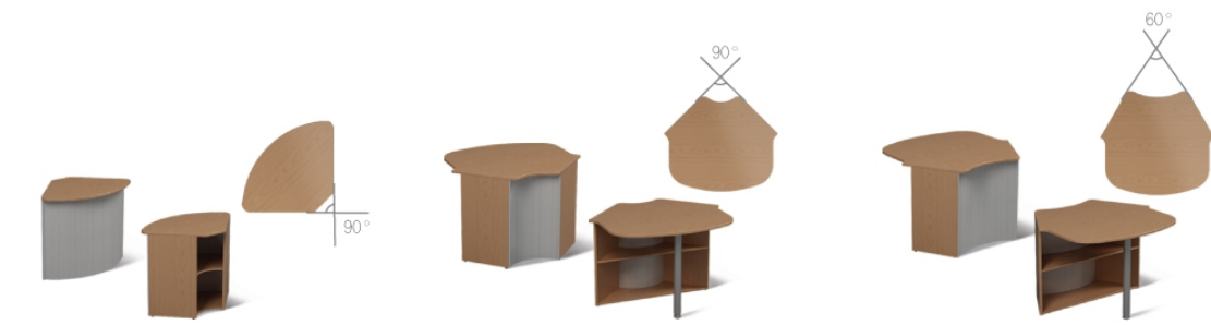
19144 грн. M8.02.02 L 694; W 694; H 750 13720 грн. M8.02.04 L 1033; W 1033; H 750 16494 грн. M8.02.05 L 1156; W 1107; H 750