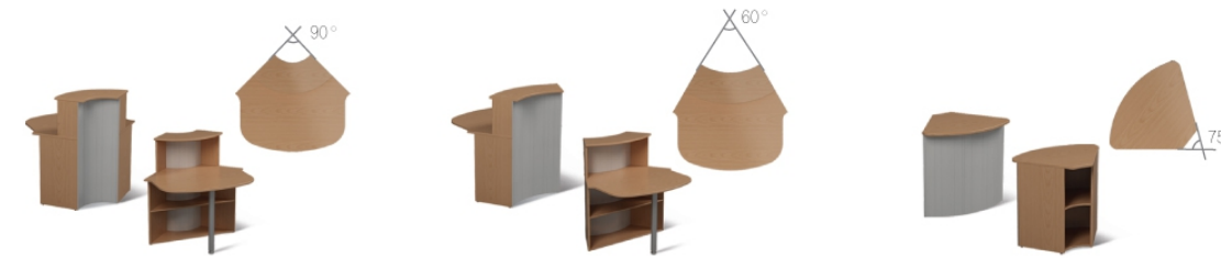
19111 грн. M8.01.04 L 1033; W 1033; H 1126 23306 грн. M8.01.05 L 1172; W 1107; H 1126 16885 грн. M8.02.01 L 662; W 664; H 750